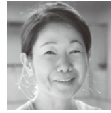
Akiko Takahashi ワークステーション 武蔵野美術大学教授