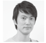
Go Hasegawa 長谷川豪建築設計事務所