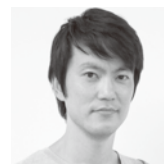
Go Hasegawa 長谷川豪建築設計事務所