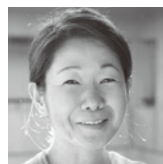
Akiko Takahashi ワークステーション 武蔵野美術大学教授